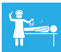
extracción de órganos